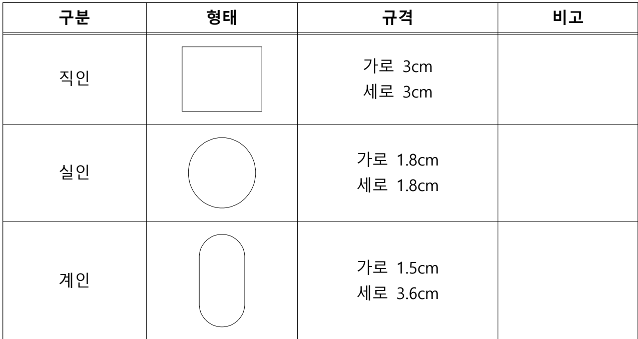
[별지 제1호 서식]